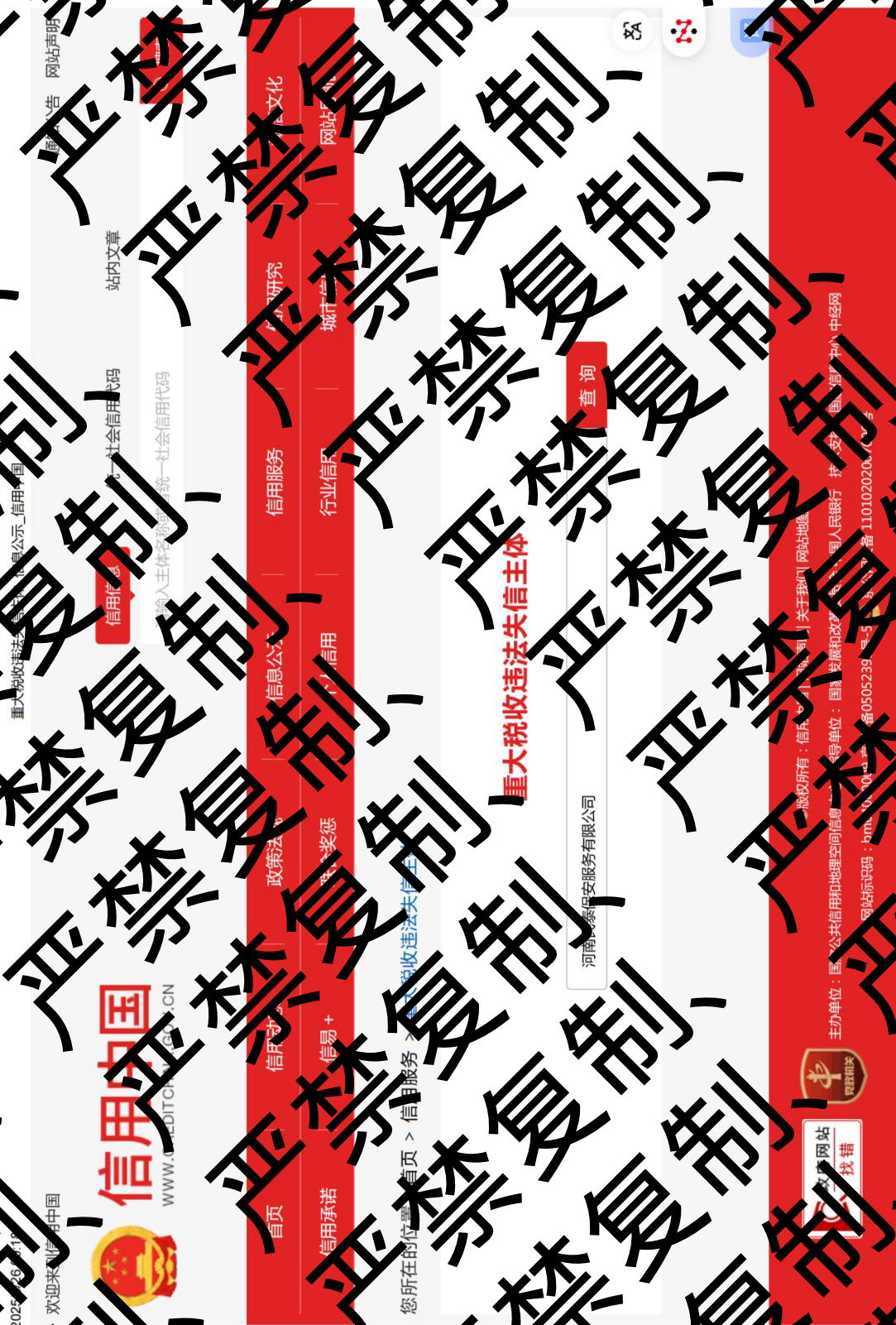
2. 重大税收违法失信主体查询截图