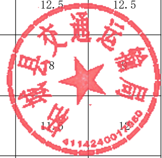
2、中标候选人报价得分表